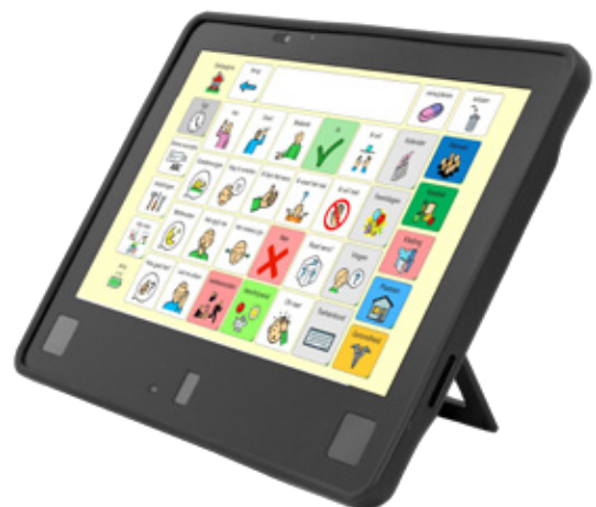
DialoQ Talk op EyeOn Air

De downloadbare inhoud omvat professioneel gemaakte communicatiebordensets. Deze bordensets zijn beschikbaar onder licentie of gratis, afhankelijk van het product. Ze kunnen rechtstreeks vanuit DialoQ Talk worden gedownload en geïnstalleerd.